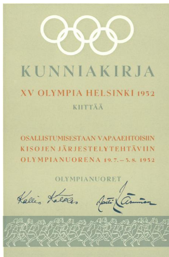
Kunniakirja olympianuorelle osallistumisesta. XV Olympia Helsinki ry Da:6

Yhdistyksen toimintakertomuksessa v. 1949 todettiin: "Itse kilpailujen järjestäminen ei huoleta, koska kunkin urheilulajin kilpailujen järjestäminen kuuluu kyseisen lajin urheiluliitolle. Kisojen onnistuneisuuden ratkaisee kisayleisön majoitus, muonitus ja muu huolto. Majoituskysymyksessä järjestelytoimikunta joutuu jännittämään voimansa äärimilleen. Päänvaivaa tuottavat erityisesti loisto-oloihin tottuneet ulkomaalaiset turistit. Tyytyvätkö turistit siihen, mitä voimme vähäisin edellytyksin tarjota?"