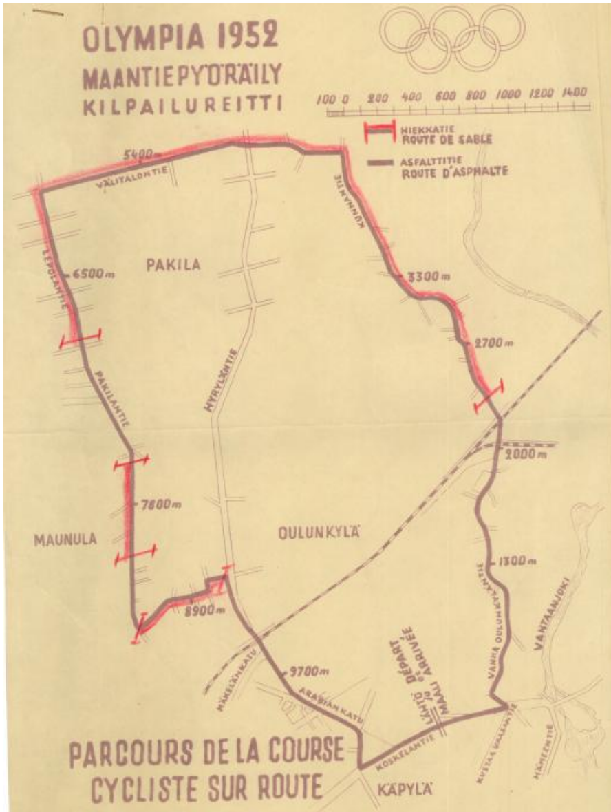
Maantiepyöräilyn kilpailureitti. Olympiara-kennus-toimisto la:14.